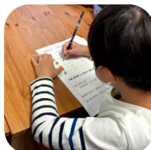
野菜を水に入れると どうなる?予想して...