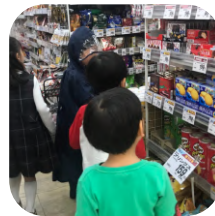
自分たちの力で必要な ものをお店で買い...