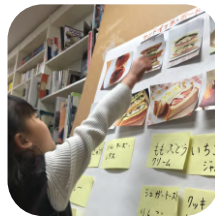
アイデアの考え方を学び、 メニューを工夫!