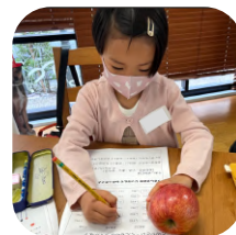
観察した内容をもとに 「なぜ？」を考えよう!