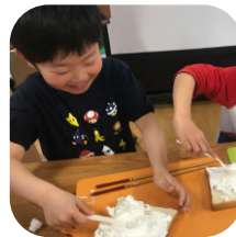
料理にもチャレンジ! 美味しくできるかな!?