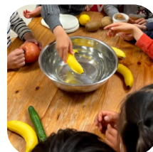
みんなでいざ実験! 結果は、浮く?沈む?!