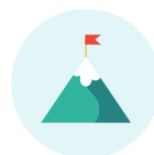
デルタチャレンジ